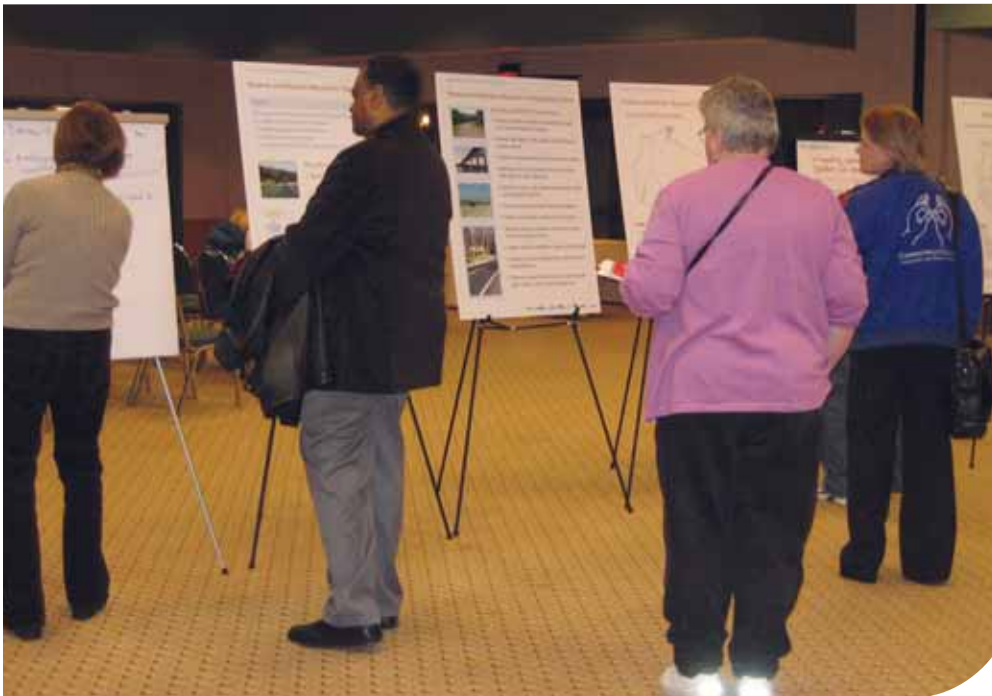
Aproximadamente 100 personas participaron en las juntas de WisDOT realizadas con organizaciones que representan a los grupos minoritarios, a los de bajos recursos y a los de adultos de la tercera edad.